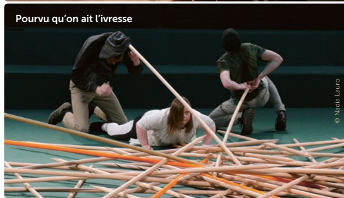
Pourvu qu'on ait l'ivresse