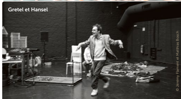
Gretel et Hansel